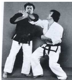
5 ème : Clef de bras en Z