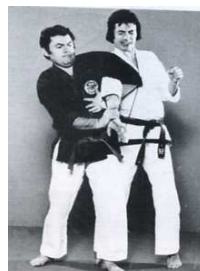
7 ème : Clef de bras en croix