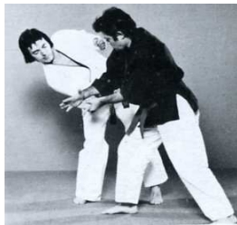
2 ème : Clef de poignet avec l'avant bras