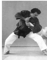
3 ème : Clef de poignet et de bras sous l'aisselle