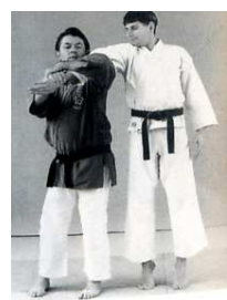
8 ème : Clef de bras tendu sur l'épaule