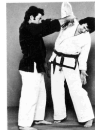
4 ème : Clef de bras