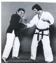
6 ème : Clef de pouce